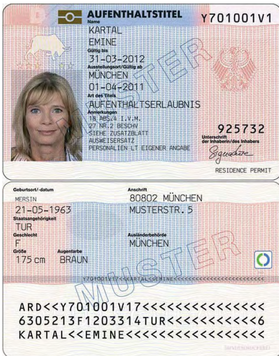
Abbildung 5 – Aufenthaltserlaubnis zur Beschäftigung

Beispiel: B hat zwar keinen Hochschulabschluss, aber eine russische Klempnerausbildung. Dieser Beruf steht auf der Positivliste der Mangelberufe. B kann eine Aufenthaltserlaubnis für die Klempnertätigkeit bei Ihnen erhalten, wenn die Ausbildung als gleichwertig anerkannt ist und B ein Gehalt erhält, das dem ortsüblichen Niveau entspricht.