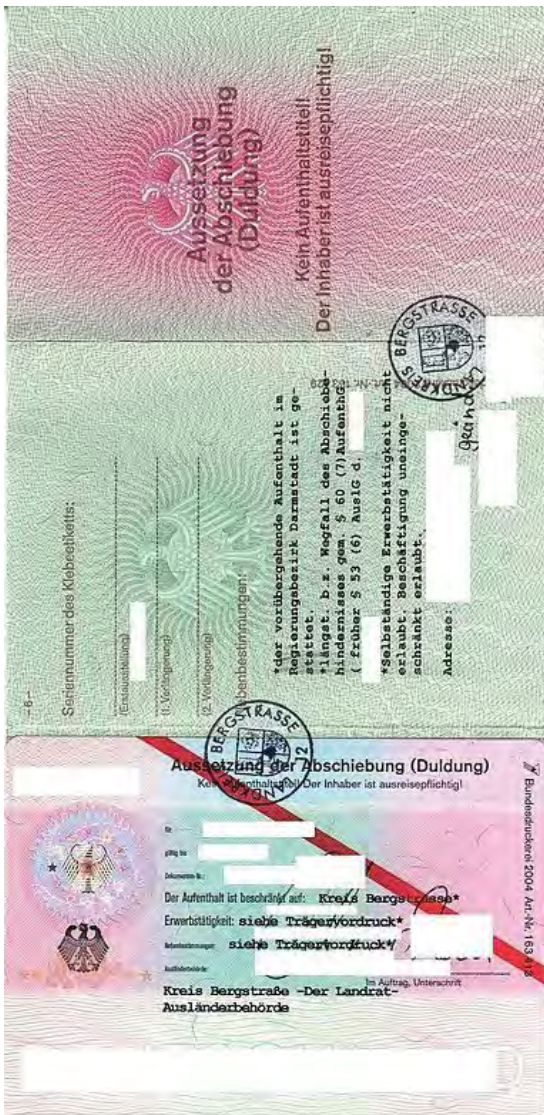
Abbildung 11 – Duldung wegen Abschiebungshindernissen