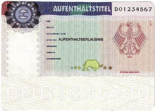
Abbildung 7 – Aufenthaltstitel als Klebeetikett

Beispiel: C ist mit einer Person mit syrischer Staatsangehörigkeit verheiratet, die als Flüchtling anerkannt ist. C hat eine Aufenthaltserlaubnis zum Familiennachzug mit der Nebenbestimmung „Erwerbstätigkeit gestattet“. C kann ohne weitere Erlaubnis in Ihrer Firma arbeiten.