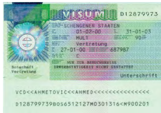
Abbildung 3 – Schengen-Visum

Möchten Sie die Bewerberin oder den Bewerber vor Abschluss eines Arbeitsvertrages erst einmal persönlich kennenlernen, ist zur Einreise in der Regel ein Visum für Besuchszwecke (sog. Schengen-Visum) erforderlich. Die Auslandsvertretung prüft insbesondere die Plausibilität des Reisezweckes und die Rückkehrbereitschaft. Zum Nachweis des Reisezweckes sollte bei der Antragstellung in der Auslandsvertretung eine Einladung zum Vorstellungsgespräch vorgelegt werden. Da eine Beteiligung anderer Behörden nicht erforderlich ist, wird über die Visumerteilung in der Regel innerhalb weniger Tage entschieden.