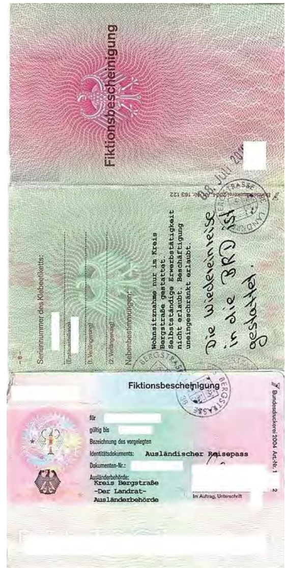
Abbildung 9 – Fiktionsbescheinigung

Der Fiktionsbescheinigung können Sie entnehmen, ob die Beschäftigung erlaubt ist und ggf. welche Beschränkungen bestehen.