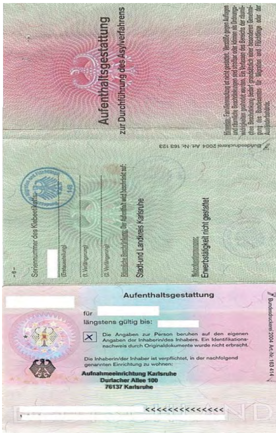
Abbildung 10 – Aufenthaltsgestattung für Personen im Asylverfahren