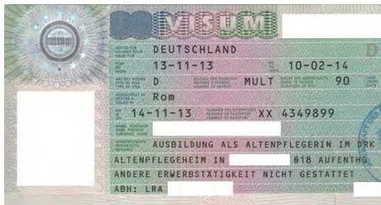
Abbildung 2 – nationales Visum

dreimonatiger Gültigkeit, das in der Regel bereits zur Aufnahme der Tätigkeit berechtigt.