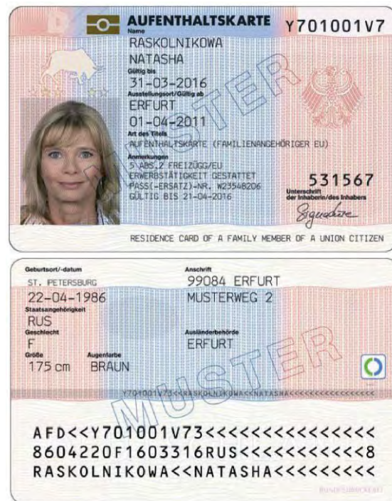
Abbildung 1 – Aufenthaltskarte für Familienangehörige von EU-Bürgerinnen und -Bürgern, die nicht selbst die EU-Staatsbürgerschaft besitzen.

Sie müssen lediglich die auch für deutsche Arbeitnehmerinnen und Arbeitnehmer geltenden Vorschriften beachten.