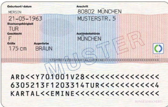
Abbildung 6 – Aufenthaltserlaubnis zur Familienzusammenführung