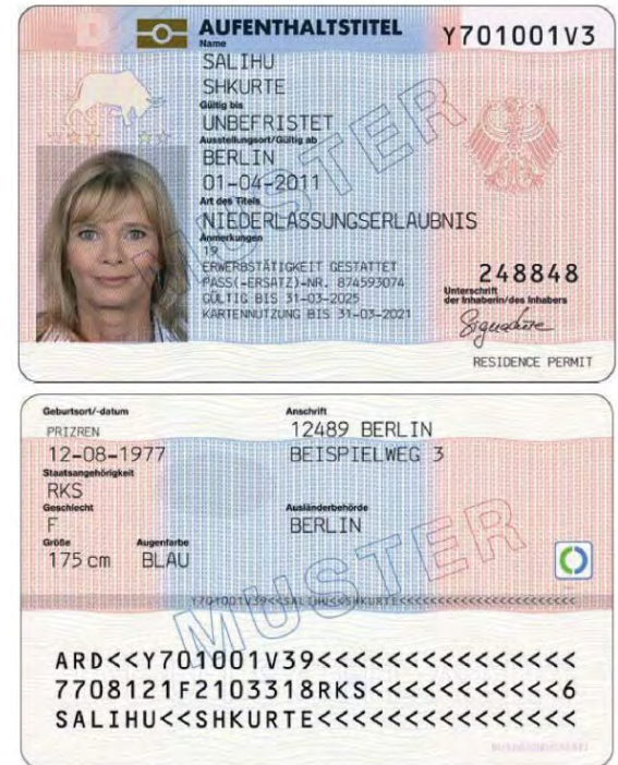
Abbildung 8 – Niederlassungserlaubnis

Personen, die eine Blaue Karte EU besitzen, erhalten eine Niederlassungserlaubnis bereits nach 33 Monaten bzw. bei Sprachkenntnissen der Stufe B1 nach 21 Monaten (§ 19a AufenthG), wenn sie in dieser Zeit sozialversicherungspflichtig beschäftigt waren. Für Absolventinnen und Absolventen deutscher Hochschulen gilt eine Frist von 2 Jahren (§ 18b AufenthG).